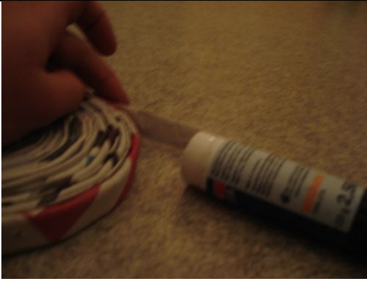
7. Beim letzten Rohr, klebst du das Ende an deine Zeitungsschnecke