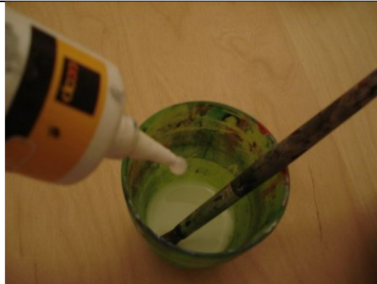
10. Mische flüssig Leim mit Wasser