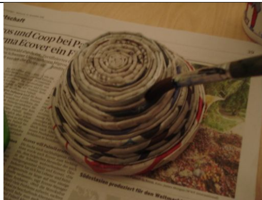
11. Streiche die Schüssel innen und aussen mit dem verdünnten Leim an