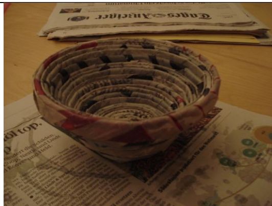
12. Trocknen lassen und deine Schüssel ist fertig!!!

Wenn du willst, kannst du sie auch noch anmalen.