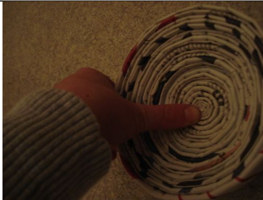
9. Forme nun vorsichtig eine Schüssel Daumen in die Mitte und hoch ziehen