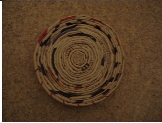
8. Jetzt sieht es so aus 😊